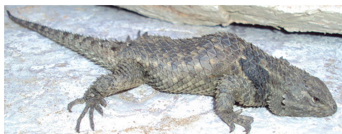
Figura 4. Ejemplar S. torquatus hembra con cifosis en las vértebras 12 y 13 (CV-R262).