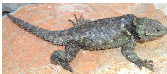
Figura 3. Ejemplar S. torquatus hembra con cifosis en las vértebras 7 y 8 (CV-R261).