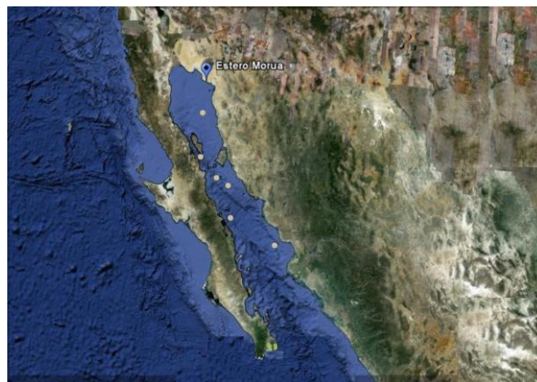
Figura 1. Localización del área de muestreo de plantas de Salicornia bigelovii en el estero “Morúa” en Puerto Peñasco, Sonora, México. Latitud Norte 31°17'38.66"N y Longitud Oeste 113°26'23.03"O.

A finales de octubre de 2009, período en cual las plantas maduras de S. bigelovii liberan naturalmente sus semillas (Troyo-Diéguez et al. , 1994) se llevó a cabo la colecta seleccionando plantas maduras y secas de una población natural establecida en el estero denominado “Morúa” en la ciudad de Puerto Peñasco, Sonora, México (Figura 1); (Latitud Norte 31°17'38.66"N y Longitud Oeste 113°26'23.03"O). Con la finalidad de separar las semillas maduras, las plantas fueron maceradas en seco y cernidas. Se seleccionaron las semillas de mayor tamaño, así como de color uniforme y sin daños aparentes.